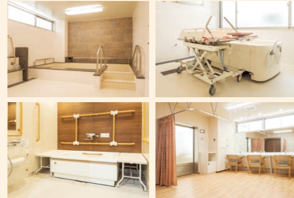
●浴室 お身体の状態に合わせてご利用いただける様々な浴室をご用意しております