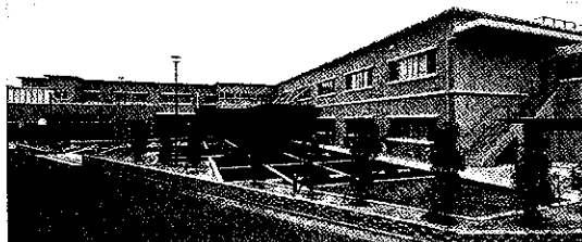
「ウエストライフ南片江」の外観

西部ガスグループの西部ガスライフサポート(株)(福岡市城南区)は、2月1日、福岡市城南区南片江6丁目に住宅型有料老人ホーム「ウエストライフ南片江」を開設した。