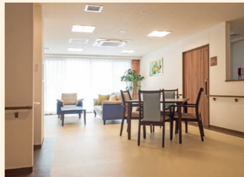
●リビング ヘルパーステーション併設の明るく広々としたリビングでの交流は日々の大切な時間です。