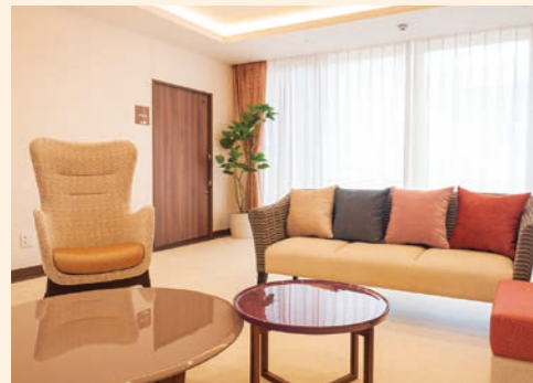
●エントランスホール 温もりを感じられる空間が大切なお客様をお迎えいたします。