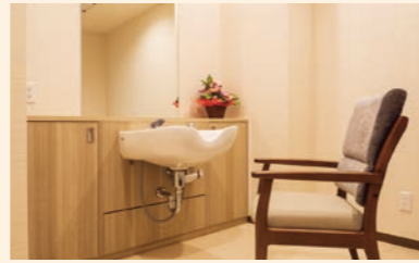
●理美容室 清潔感のある理美容室はプライベートサロンとしてご利用ください。 ※訪問サービスとなり別途実費が必要です。