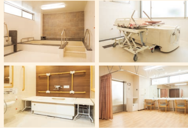
●浴室 お身体の状態に合わせてご利用いただける様々な浴室をご用意しております。