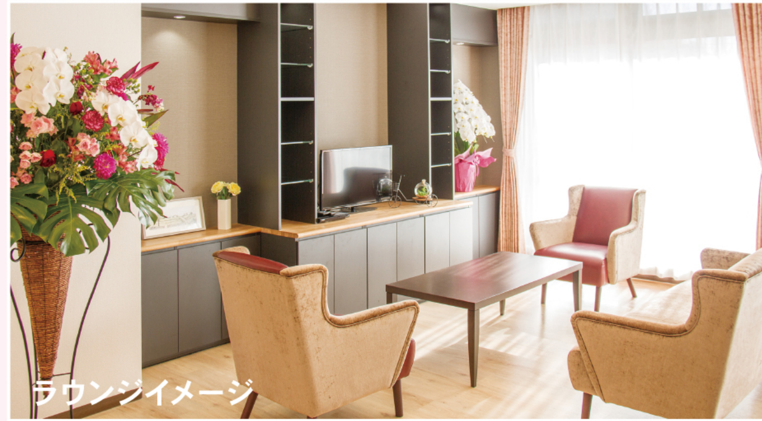
ラウンジイメージ