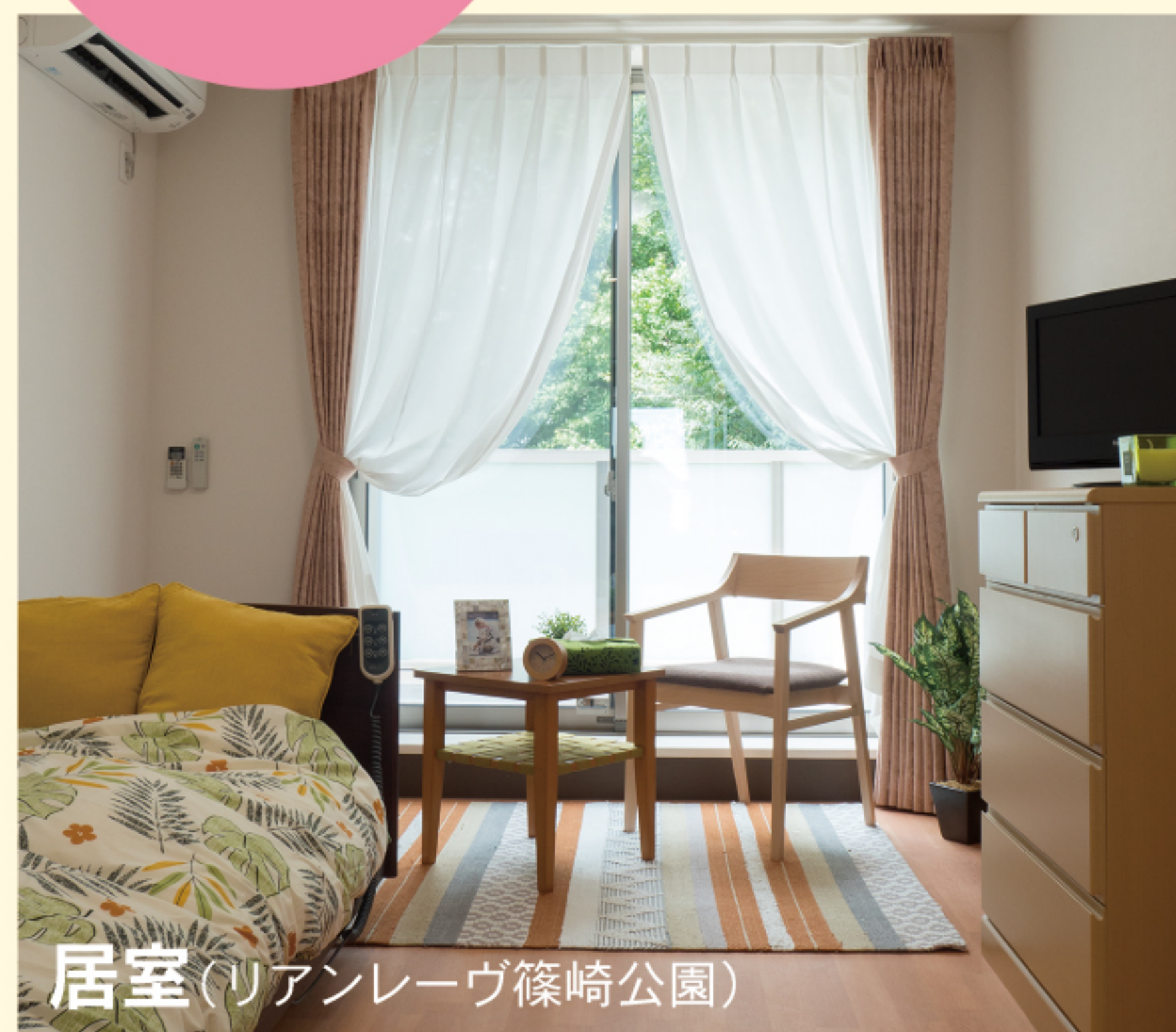
居室(リアンレーヴ篠崎公園)