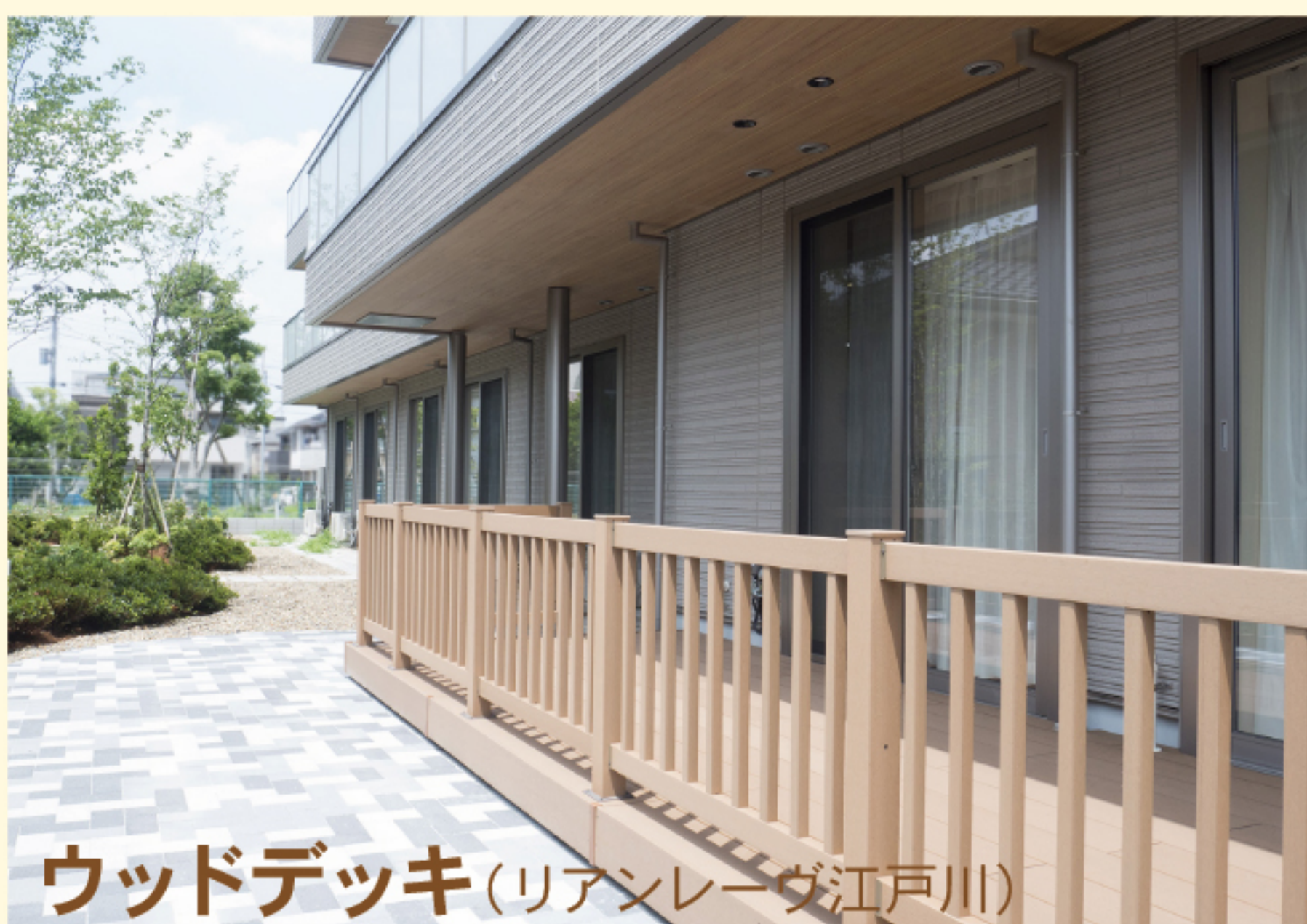
ウッドデッキ(リアンレーヴ江戸川)