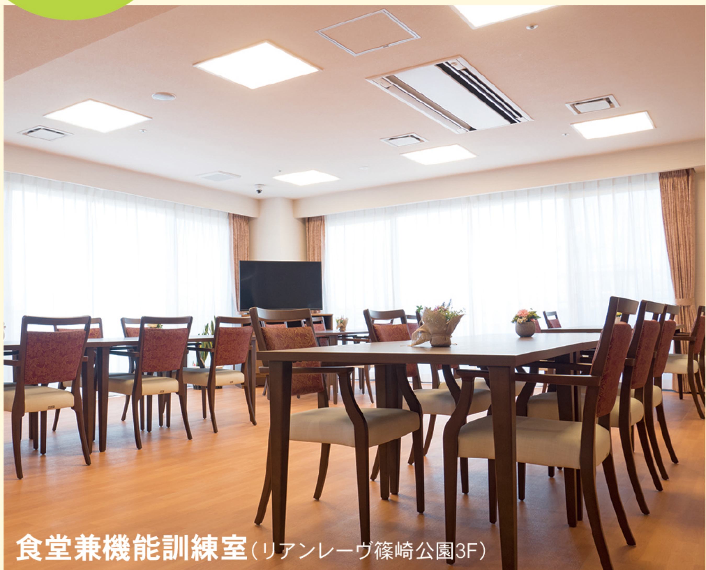
食堂兼機能訓練室(リアンレーヴ篠崎公園3F)

ご自宅で過ごすような「くつろぎ」を演出し、 毎日の暮らしをより豊かにする共用設備