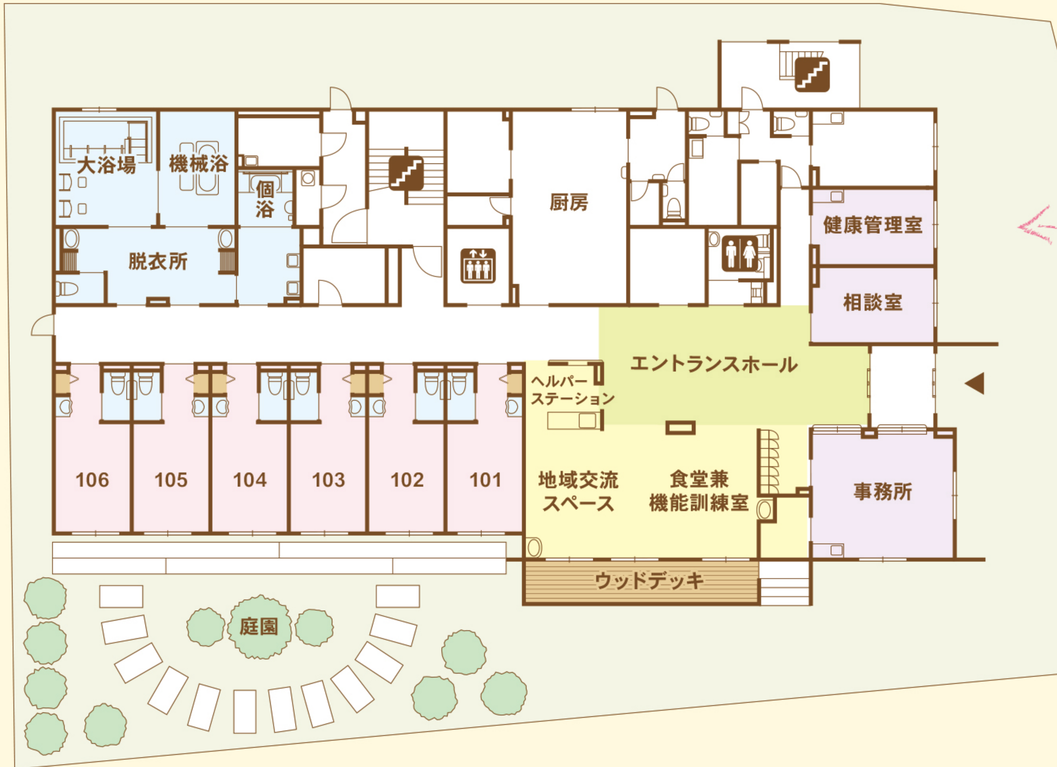
リアンレーヴ江戸川 【1Fフロアガイド】