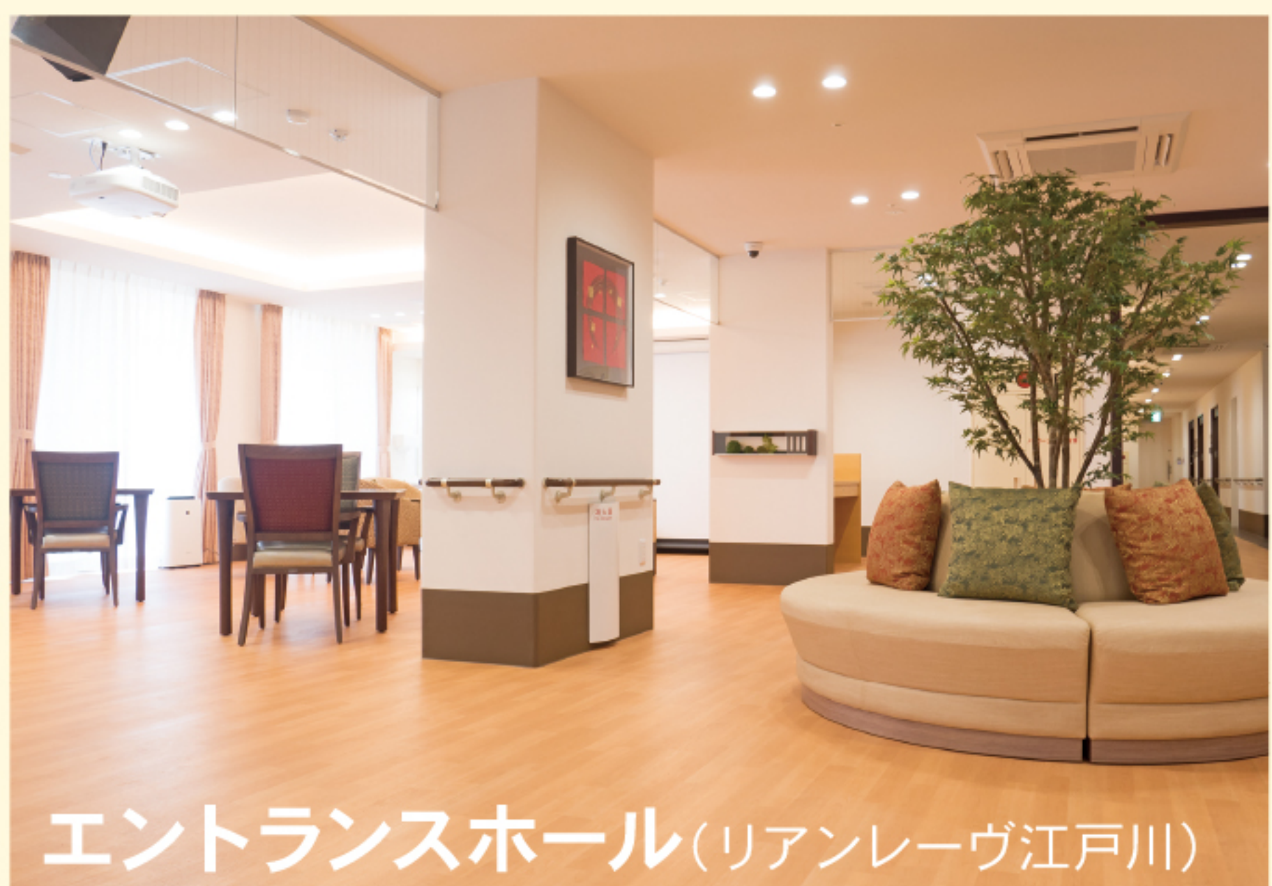
エントランスホール(リアンレーヴ江戸川)