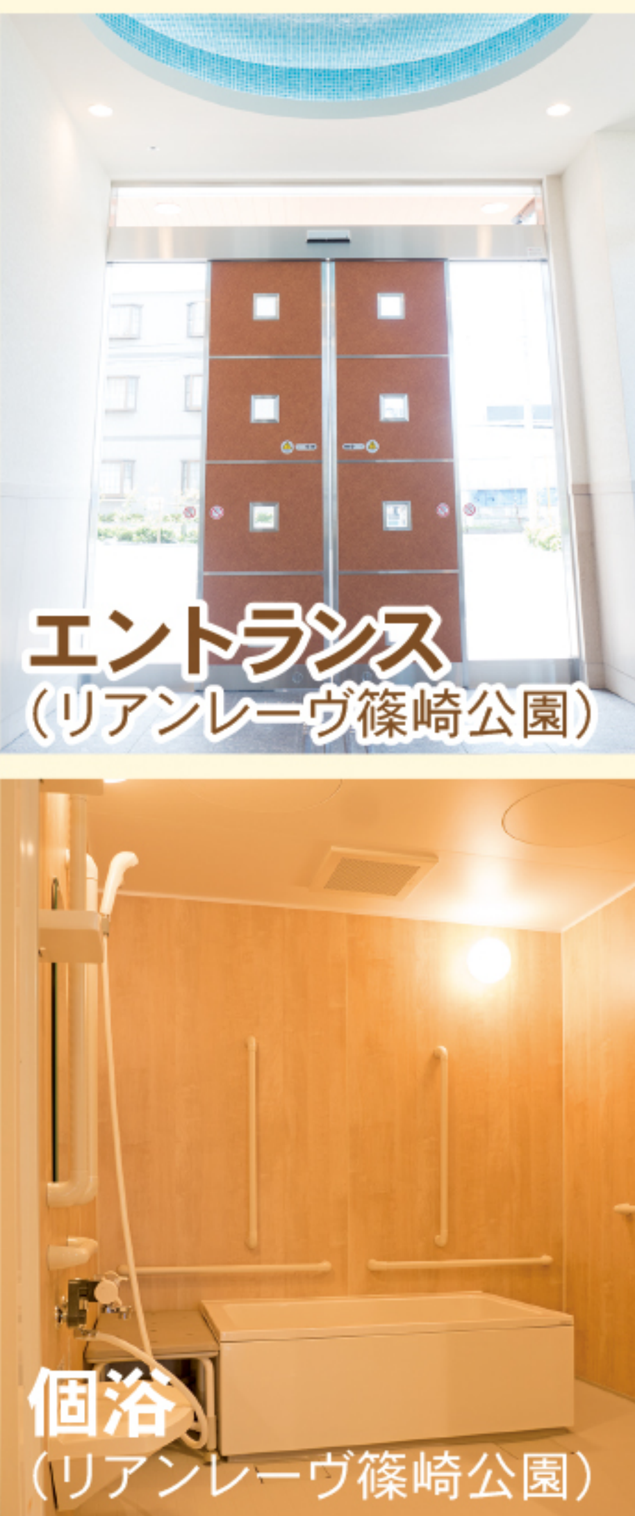
エントランス (リアンレーヴ篠崎公園)