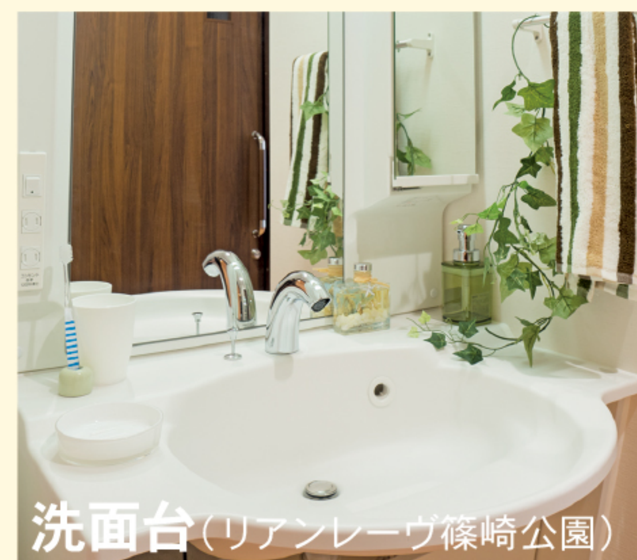
洗面台(リアンレーヴ篠崎公園)