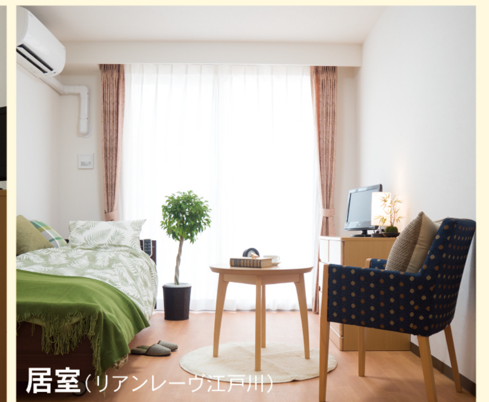
居室(リアンレーヴ江戸川)