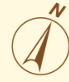
リアンレーヴ篠崎公園 【1Fフロアガイド】