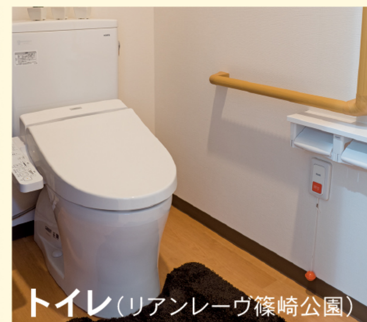
トイレ(リアンレーヴ篠崎公園)