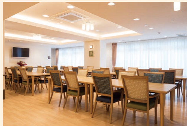
● 食堂兼機能訓練室 広々とした食堂兼機能訓練室では、ホーム内の厨房でご用意した温かい食事が並びます。