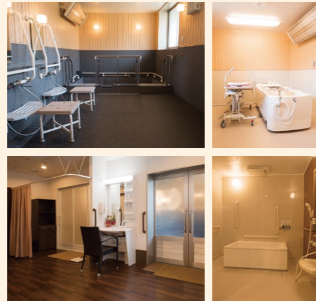
● 浴室 お身体の状態に合わせてご利用いただける、様々な浴室をご用意しております。