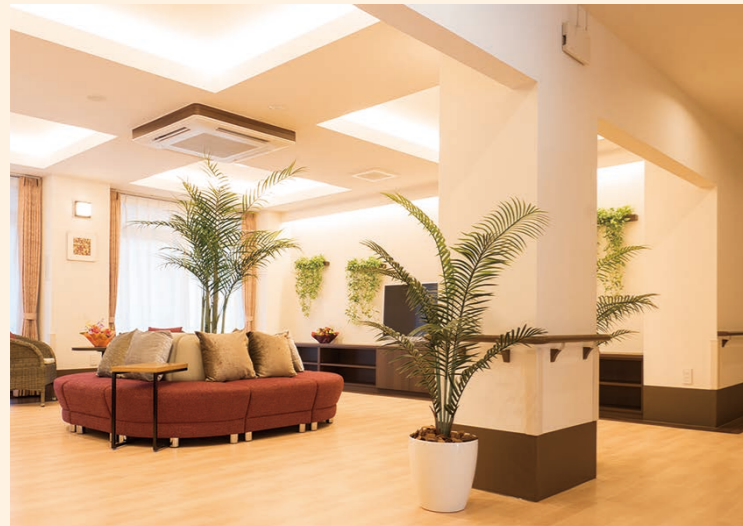
● エントランスホール 寛ぎの空間で自由に歓談をお楽しみください。