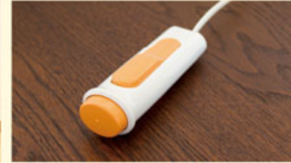
居室及び共用設備の写真は全て「木下の介護」施設で撮影されたイメージです。