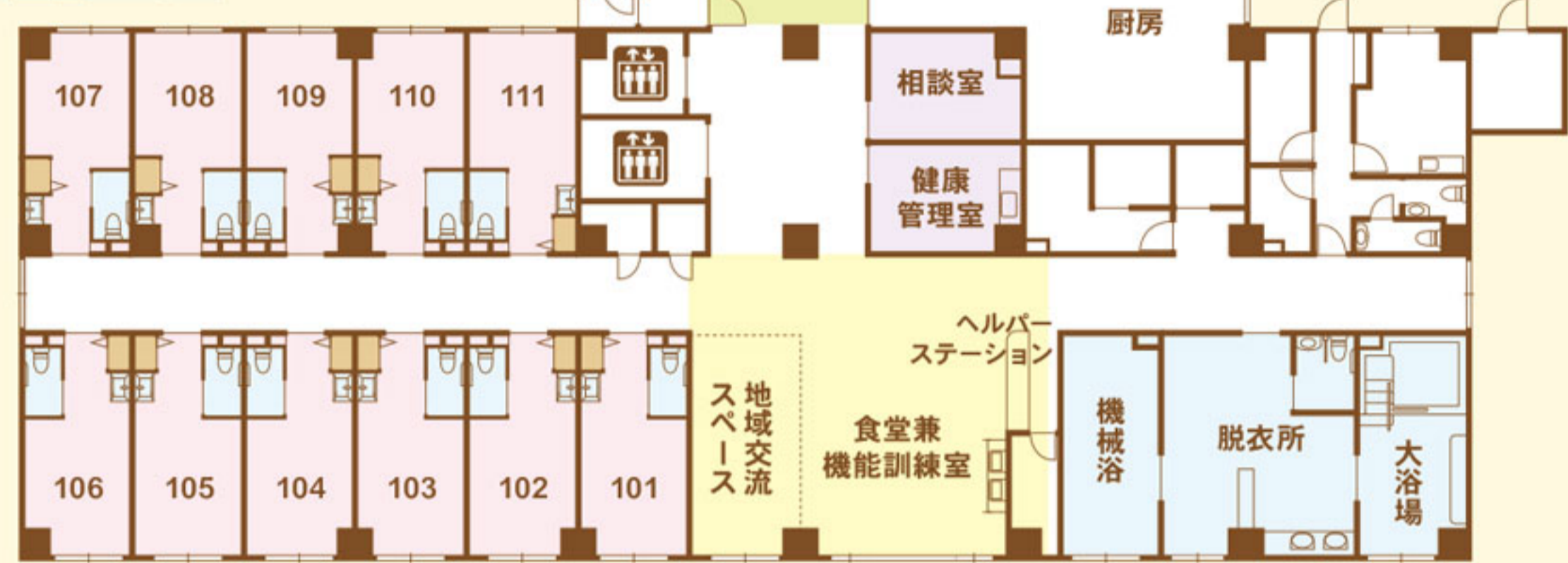
リアンレーヴ篠崎公園 【1Fフロアガイド】

ご自宅で過ごすような「くつろぎ」を演出し、 毎日の暮らしをより豊かにする共用設備