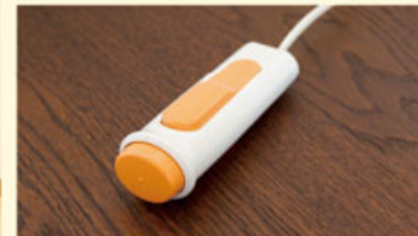
居室及び共用設備の写真は全て「木下の介護」施設で撮影されたイメージです。