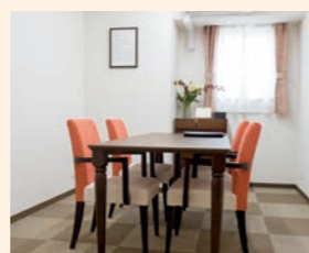
● 相談室 日々の生活相談や、ご家族からのご要望など、プライベートなお話は個室でも対応が可能です。