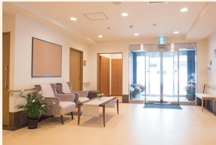
● エントランスホール 明るく広々とした空間が大切なお客様をお迎えいたします。