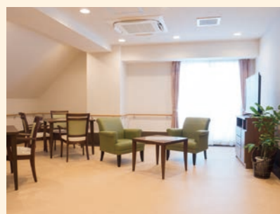
● リビング ゆったりとしたスペースで自由に歓談をお楽しみください。