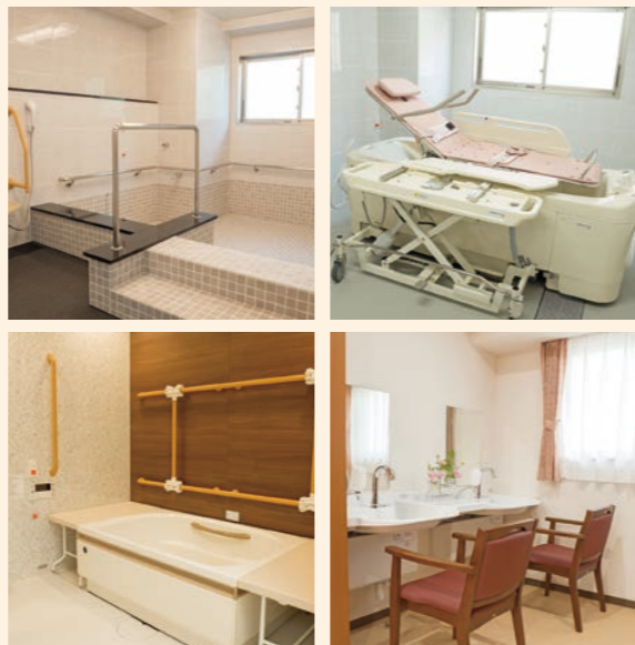
● 浴室 お身体の状態に合わせてご利用いただける様々な浴室をご用意しております。