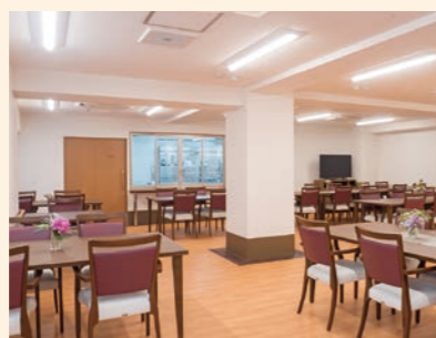
● 食堂兼機能訓練室 広々とした食堂兼機能訓練室では、ホーム内の厨房でご用意した温かい食事が並びます。