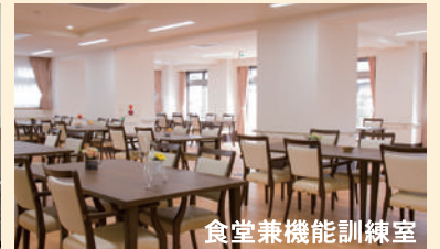
食堂兼機能訓練室