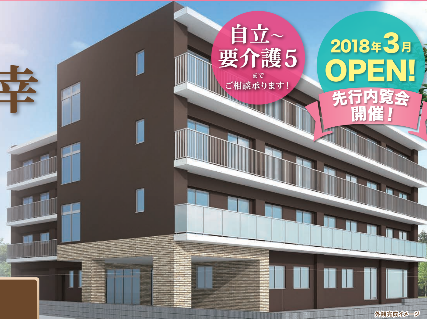
外観完成イメージ