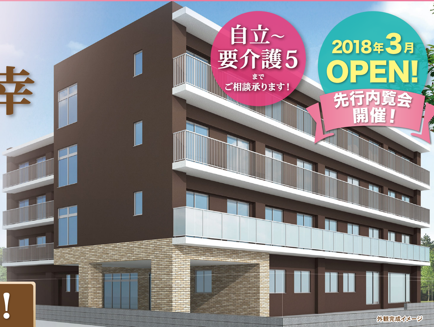
外観完成イメージ