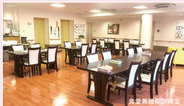
食堂兼機能訓練室