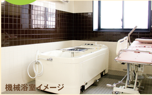
機械浴室イメージ

ご自宅で過ごすような「くつろぎ」を演出し、 毎日の暮らしをより豊かにする共用設備