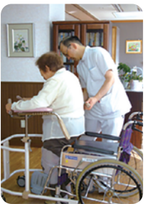
器具を用いたリハビリの様子