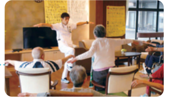
コグニサイズの様子