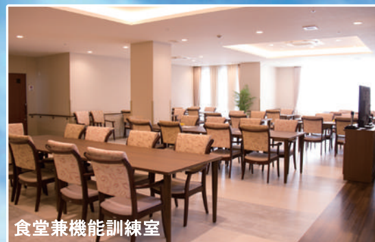
食堂兼機能訓練室