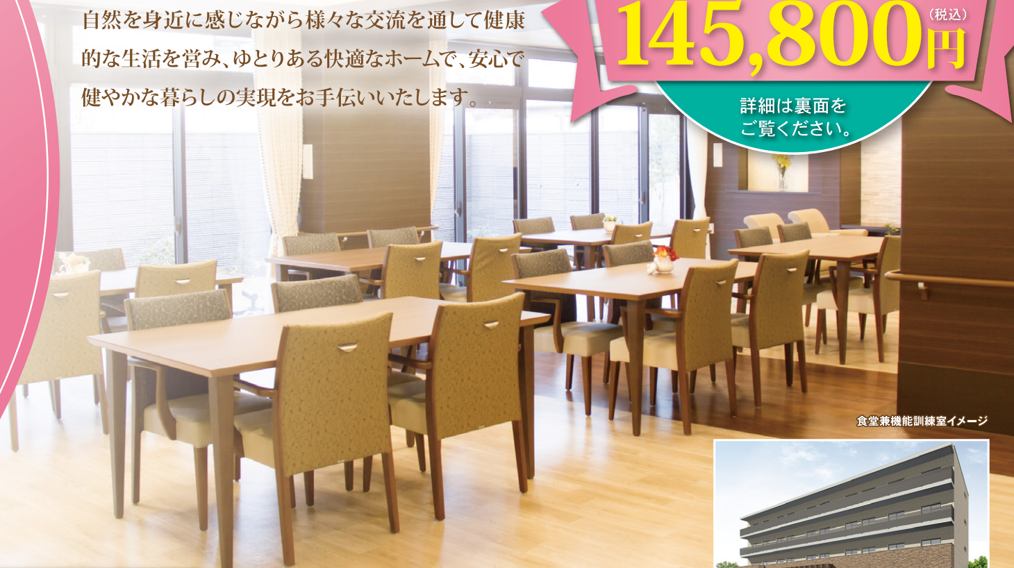
食堂兼機能訓練室イメージ