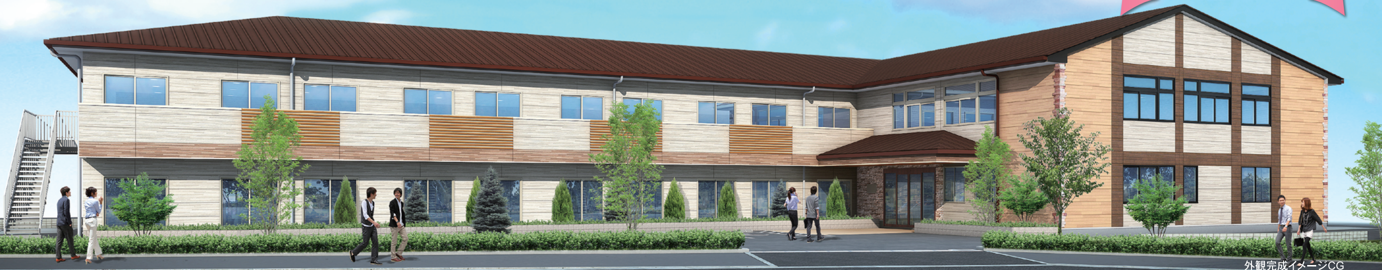
外観完成イメージCG