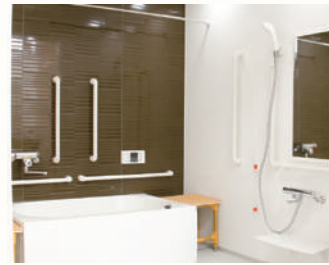
個浴イメージ (リアンレーヴさいたま新都心)