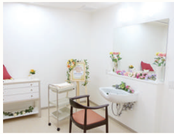
理美容室イメージ (リアンレーヴはるひ野)

ご自宅で過ごすような「くつろぎ」を演出し、 毎日の暮らしをより豊かにする共用設備