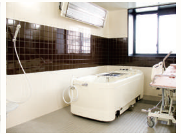
機械浴イメージ (リアンレーヴさいたま新都心)