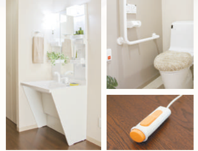
居室イメージ (リアンレーヴ市川)