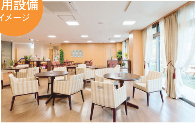
リビングイメージ (リアンレーヴ本町田)

ご自宅で過ごすような「くつろぎ」を演出し、 毎日の暮らしをより豊かにする共用設備