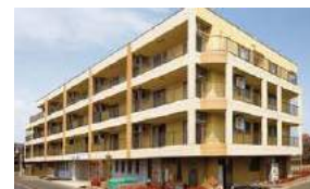
介護付有料老人ホーム 応援家族 東川口