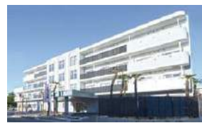
サービス付き高齢者向け住宅 介護付有料老人ホーム リアンレーヴ大宮