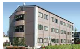
介護付有料老人ホーム ライフコミュニケーション大宮北