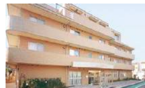
介護付有料老人ホーム ライフコミュニケーション大宮東