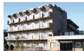
介護付有料老人ホーム ライフコミュニケーション南与野