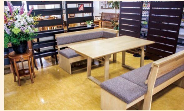
● エントランスホール