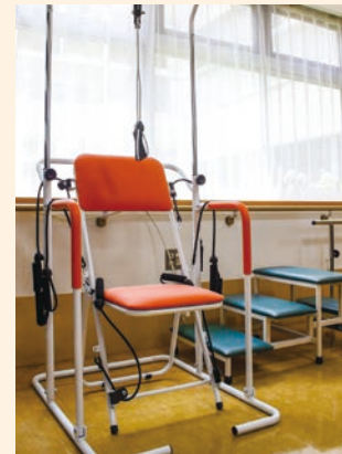
● 機能訓練スペース